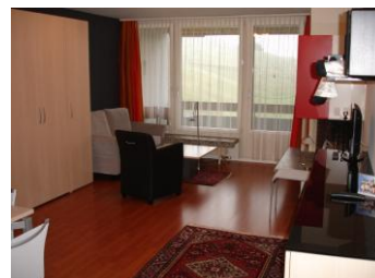
Veduta d'insieme di alloggio