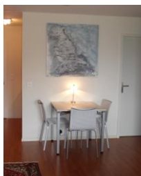
Tavolo da pranzo