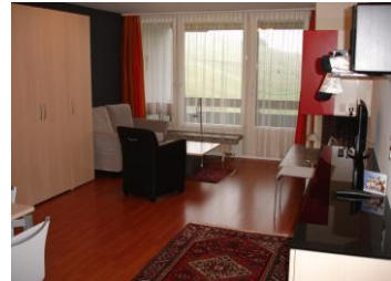
sofá o sofá para dormir