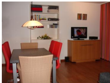
Esstisch mit Sideboard TV/Hi-Fi